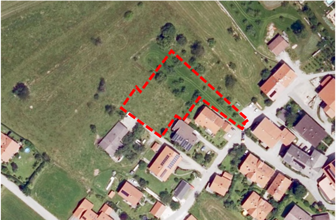
Abbildung 1: Lage des Planungsgebietes (Geltungsbereich rot ) - ohne Maßstab

Das Planungsgebiet befindet sich etwa 130 m nordwestlich des Ortszentrums von Törwang in der Gemeinde Samerberg. Im Nordwesten und Nordosten grenzen landwirtschaftlich genutzte Flächen an das Planungsgebiet. Südlich grenzt Wohnbebauung an das Planungsgebiet, im Westen schließt sich weitere Bebauung an. Im Südosten grenzt das Planungsgebiet an die öffentliche Verkehrsfläche „Am Anger“.