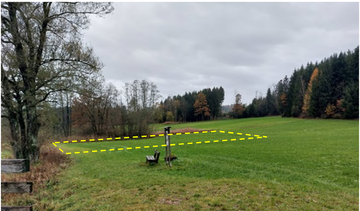
Abbildung 4: Ausgleichsfläche 1 (gelb) 12.2023 - ohne Maßstab

Der Ausgleich erfolgt auf zwei Teilflächen (Ausgleichsfläche 1 (A1) 1.412 m 2 und Ausgleichsfläche 2 (A2) 400 m 2 ). Der Eingriff mit 5.835 Wertpunkten kann mit diesen Maßnahmen durch 5.836 WP vollumfänglich ausgeglichen werden.