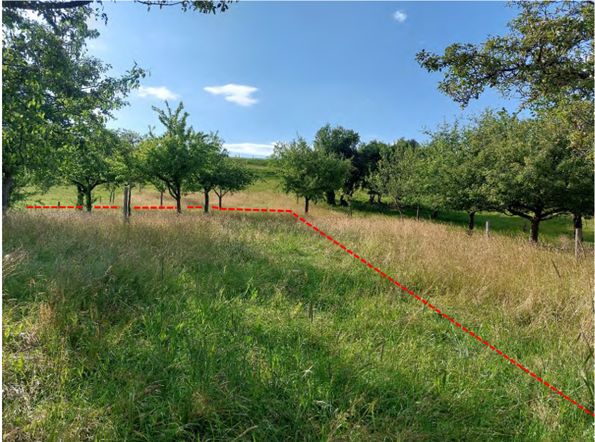
Abbildung 6: Verbleibender Obstbaumbestand im Norden und Osten des Plangebietes. Durch die vorhandene Hangkante im Norden besteht eine geringe Einsehbarkeit