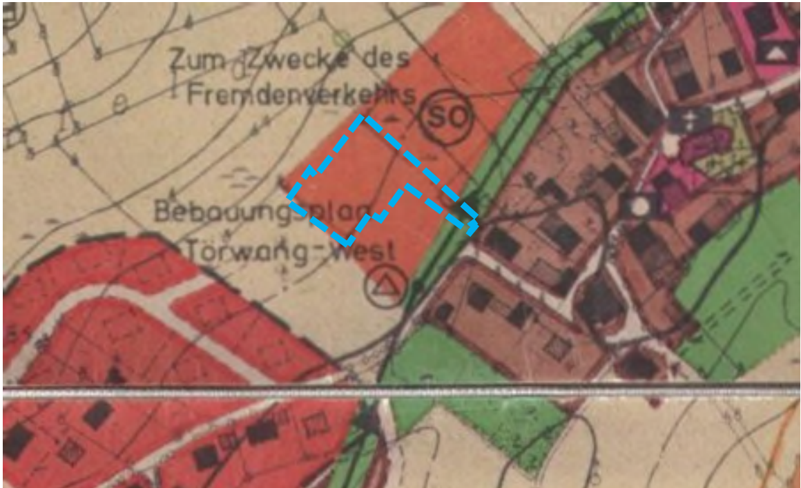
Abbildung 2: Darstellung im Flächennutzungsplan (Geltungsbereich blau) - ohne Maßstab

Für das Planungsgebiet ist im rechtskräftigen Flächennutzungsplan im Geltungsbereich ein „Sondergebiet (Fremdenverkehr)“ und im Süden eine „Elektrische Freileitung mit Baubeschränkungszone“ dargestellt. Diese wurde jedoch bereits verkabelt und besteht nicht mehr.