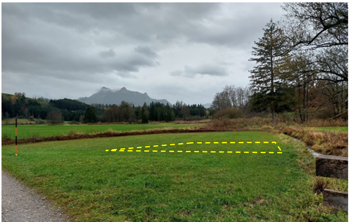
Abbildung 5: Ausgleichsfläche 2 (gelb) 12.2023 - ohne Maßstab