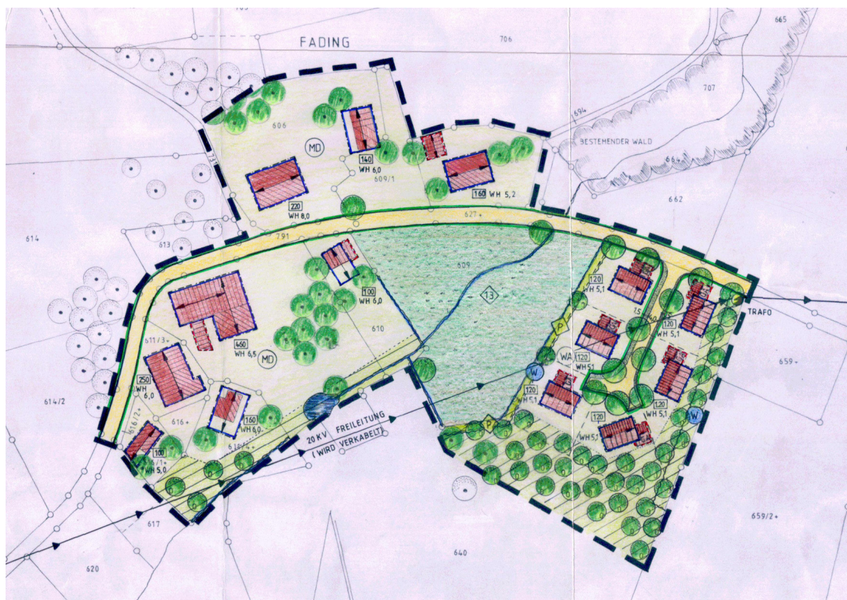
Abb. Bebauungsplan Fading

Der seit 22.08.2001 rechtskräftige Bebauungsplan "Fading" ist die Grundlage der vorliegenden ersten Bebauungsplanänderung, die auf einem aktuellen Auszug der digitalen Flurkarte mit den inzwischen errichteten Gebäuden erstellt wurde.